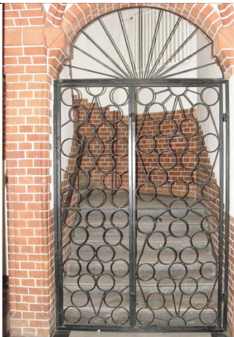
Fot.8. Widok zabytkowej balustrady w bocznej klatce schodowej.