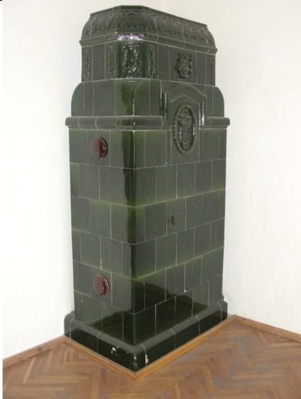
Fot.5. Piec kafelowy –transfer sala konferencyjna