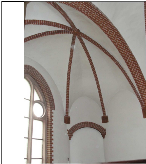
Fot.3. Sklepienie w głównej klatce schodowej.