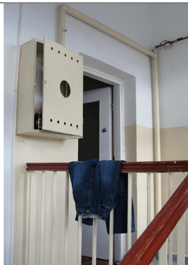
Fot.14. Widok bocznej klatki schodowej w obrębie mieszkań nieobjętych opracowaniem.