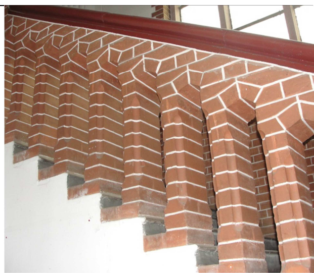
Fot.2. Pierwotna ceramiczna balustrada.