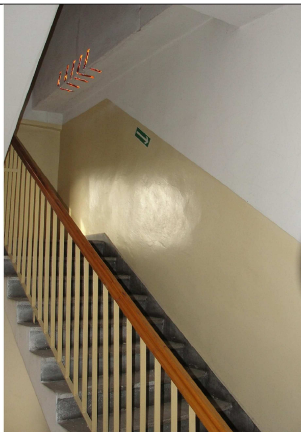
Fot.10. Widok kraty na głównej klatce schodowej prowadzącej z parteru na Piętro. Widok z parteru.