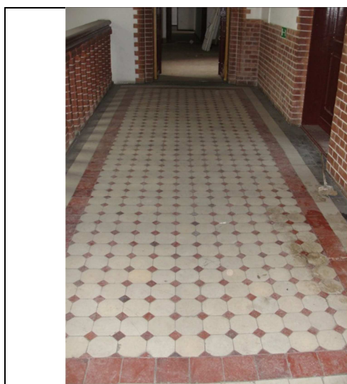
Fot.1. Wzór pierwotnej ceramicznej posadzki.