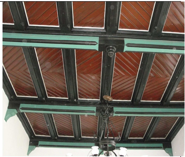
Fot.4. Zabytkowy drewniany strop w sali konferencyjnej.