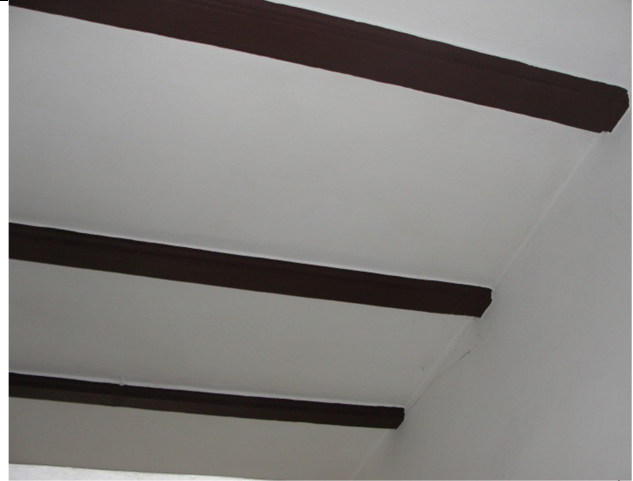
Fot.6. Fragment drewnianego stropu w pom. byłych sanitariatów.