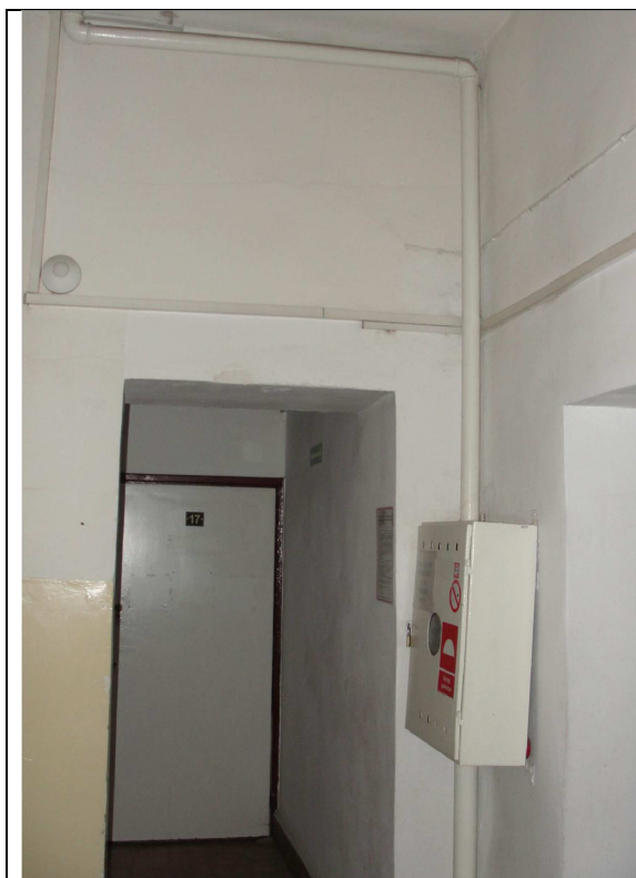
Fot.13. Boczna klatka schodowa - istniejący hydrant.