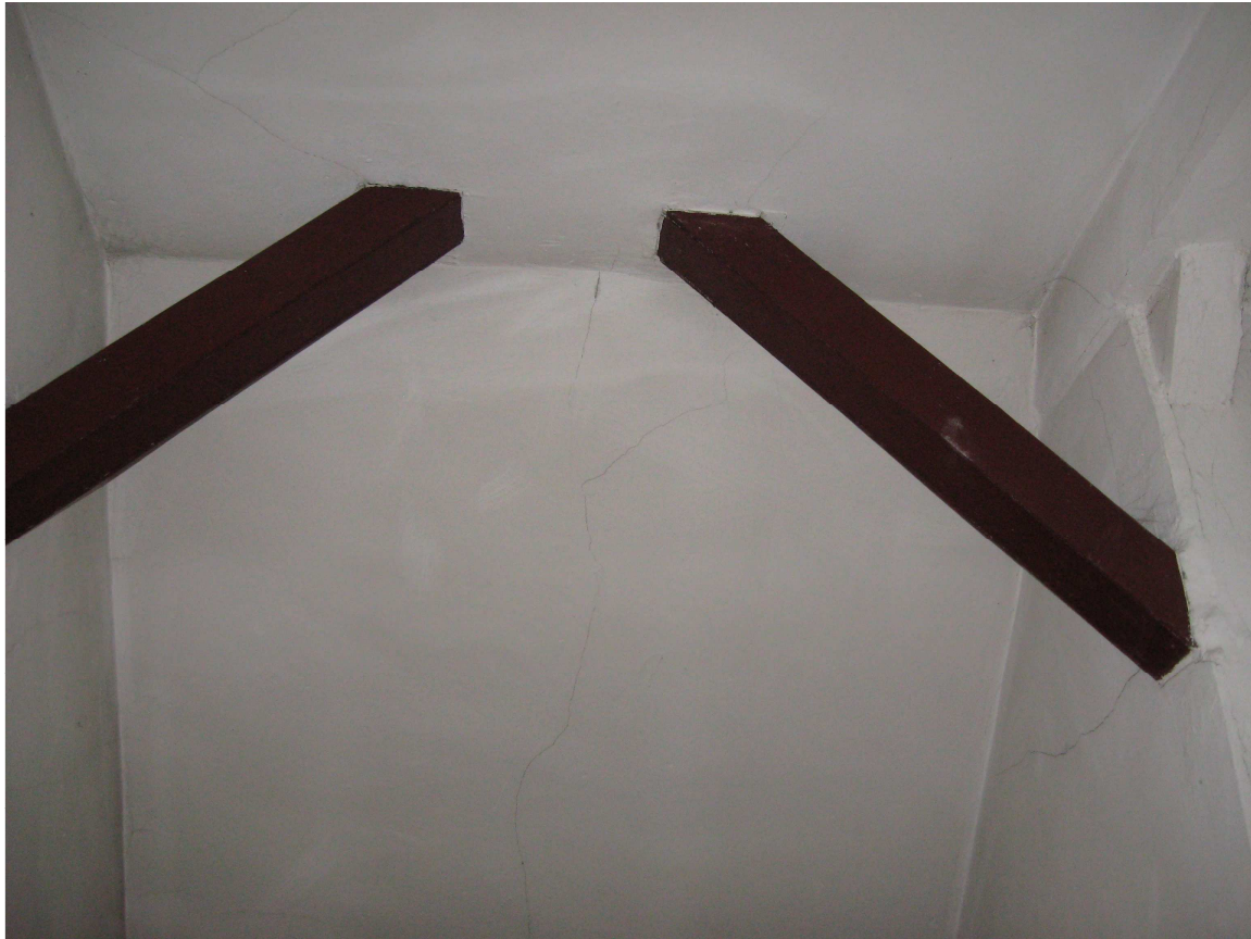
ZDJĘCIE NR 10 FRAGMENT KONSTRUKCJI WIĘŻBY DACHOWEJ ORAZ PODBITKI (widoczny dobry stan mieczy słupów, zastrzałów, kleszczy zabezpieczonych farbą olejną oraz zarysowania na powierzchni podbitki)