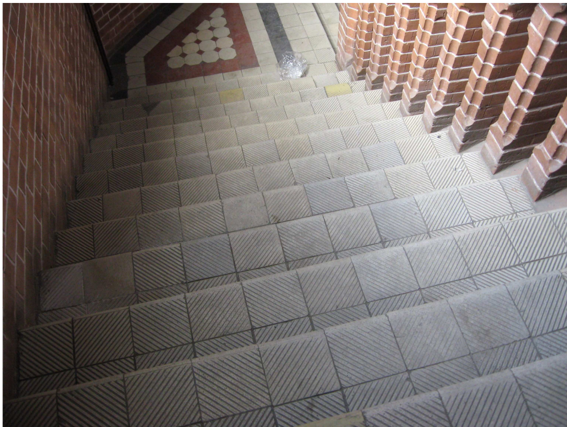
ZDJĘCIE NR 8 SCHODY WEWNĘTRZNE W CZĘŚCI SKRAJNEJ (widoczne żelbetowe schody wykończone lastriko znacznie wyeksplotowanym i wytartym)